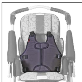
Vesta fixační 5004409