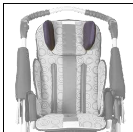
Opěrka hlavy nastavitelná 5004419