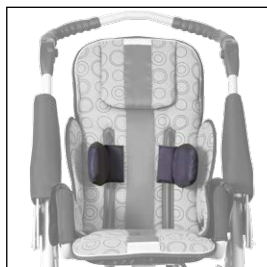
Opěrka podpažní nastavitelná 5004420