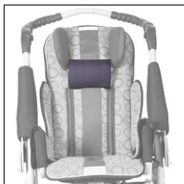
Opěrka hlavy s krční podpěrrou 5004426