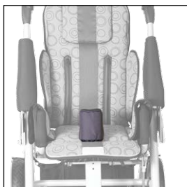
Klín abdukční 5004422