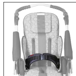
Fixace pánevní 5004413