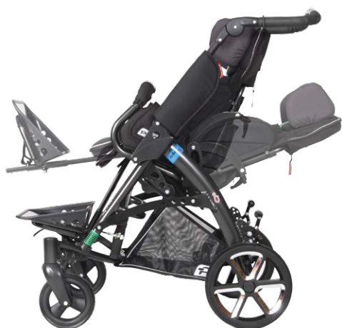
plně nastavitelný kočárek