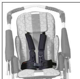
Fixační pás čtyřbodový 5004421