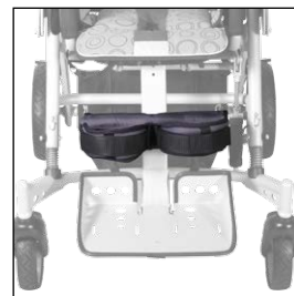
Opěrka lýtková s fixací 5004414