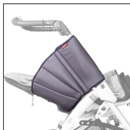
Chrániče s polohováním zad 5004406