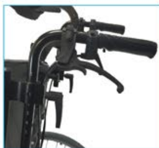
Výškově nastavitelná rukojeť